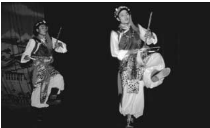
TIPA-kunstnere opfører en folkedans fra Kham-region, hvor mændene spiller på piwang, en lille to-strengt instrument, mens de danser med højtløftede ben.

En anden uddannelse på TIPA er læreruddannelsen- „Teachers Training Course“ (TTC) – et ca. treårigt uddannelsesforløb, som kvalificerer unge tibetanere til et arbejde som musiklæ-