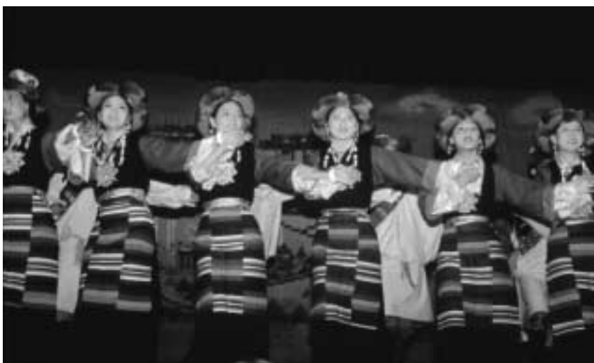
En opførelse af en folkedans fra den sydlige Centraltibet.