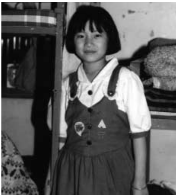
Mange skolebørn bliver sponsoreret igennem Tibet-Hjælp hvert år.