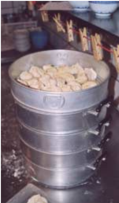
Momos er klar til at blive dampet.