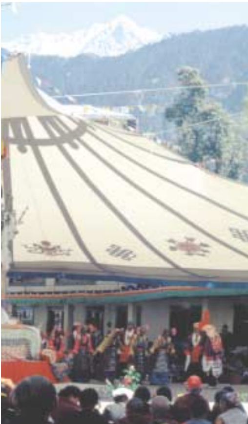
Under Shoton-festivalen er TIPAs gårdsplads tildækket af en stor markise dekoreret med lykkebringende symboler.

mere moderne former for underholdning som rockkoncerter og moderne dramaer, der appellerer til et bredere publikum og tiltrækker flere unge tibetanere end de traditionelle forestillinger. Mens nogle af de mere konservative medlemmer af det tibetanske eksilsamfund føler, at disse fornyelser står i modsætning til idealet om kulturbevarelse, er TIPAs klar over, at –