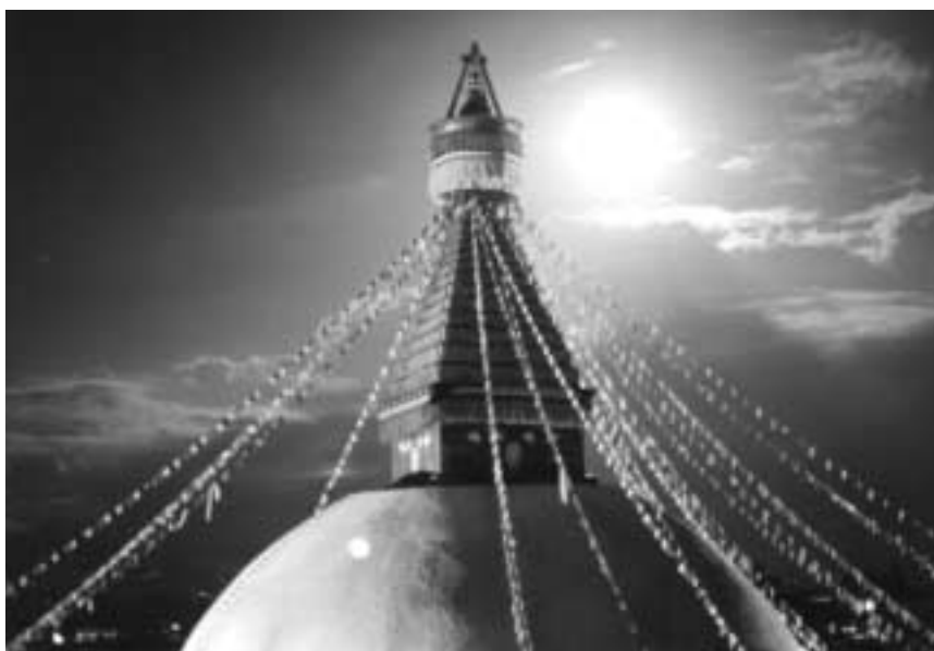
100.000 smørlamper lyser Boudnath stupaen i Kathmandu op hvert år for at fejre Guru Rinpoche. I Berit Madsens film De hundredtusinde lampers dag følger hun en gruppe børn, som sætter lamperne op på stupaen.