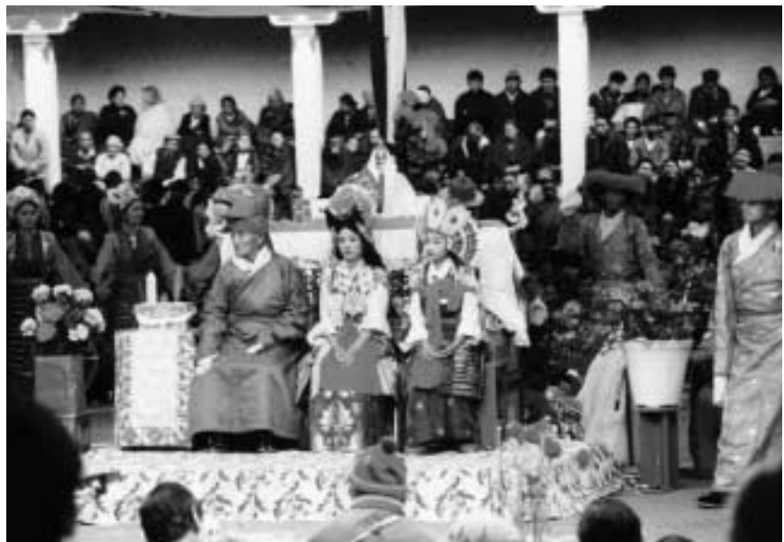
En scene fra lhamo-forestillingen Norsang opført på Shoton-festivalen som finder sted på TIPA hvert forår.

TIPA fungerer som en skole, hvor unge tibetanske flygtninge lærer traditionelle sange, danse, musik og især lhamo, tibetansk opera, hvis bevarelse anses som instituttets vigtigste opgave. Der bor ca. 130 mennesker på TIPA: kunstnere, studerende og lærere, samt administrative og andre medarbejdere og deres familier. Siden 1989 har TIPAs kunstnere regelmæssigt turneret i Europa og Nordamerika.