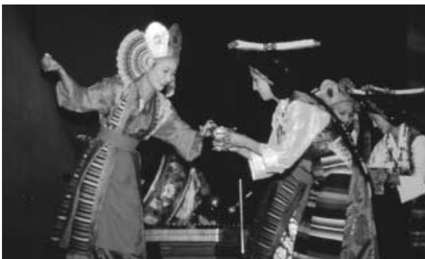
En rituel ofring med tsampa (bygmel) og chang (tibetansk øl) opføres i slutningen af en TIPA performance. Kunstneren t.v. er udklædt som en lhamo eller fe, og kunstneren t.h. bærer den traditionelle chupa og hovedbeklædning fra Centraltibet.