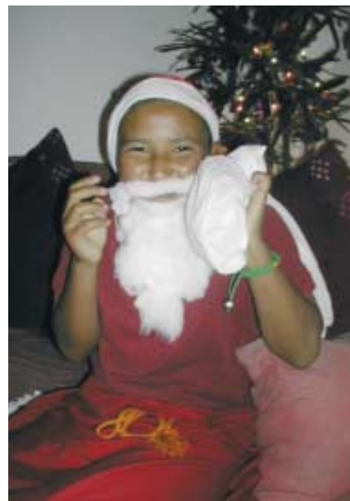
En af de unge nonner fra Arya Tara skolen har klædt sig ud som julemanden.

Nonnerne tager i første omgang kun tilflugtsløftet (Red. Jeg tager min tilflugt til Buddha, Dharma og Sangha), så de er helt frie til at forlade klosteret, hvis de har lyst.“